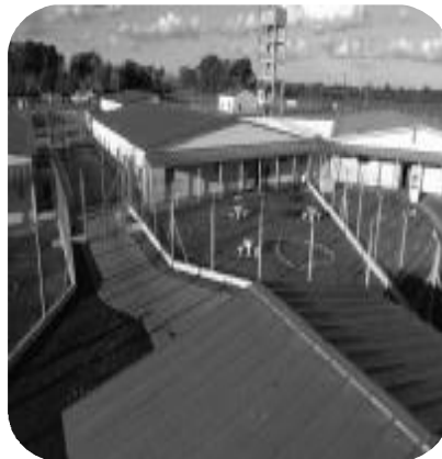
Vista panorámica de la Unidad Penal 18 de Gorina.