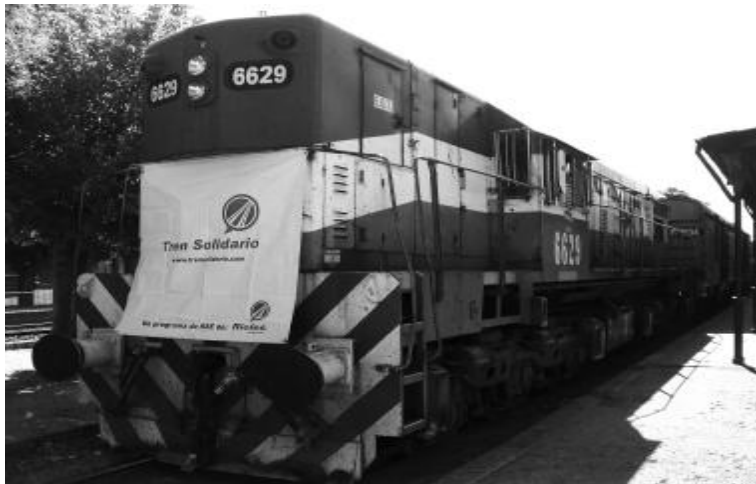
El Tren Solidario en la estación de Tolosa, antes de partir rumbo a Tartagal.

Me parece que fue muy importante que una ciudad universitaria como la nuestra, colaborara con la gente que tiene tantos padeceres.