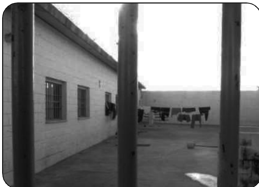
Patio Interno Unidad carcelaria.

Para comunicarte con el COFAM llamá al 0221-154352404