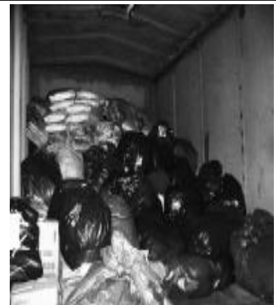
Uno de los vagones cargado de mercadería donada por los ciudadanos platenses.

La idea de este proyecto es que ante el innegable cambio climático y la proximidad de catástrofes, la Universidad tenga un equipo de voluntarios, compuesto por alumnos, docentes y graduados, capacitados para brindar su apoyo profesional y, sobre todo, humano, a quienes lo necesiten.